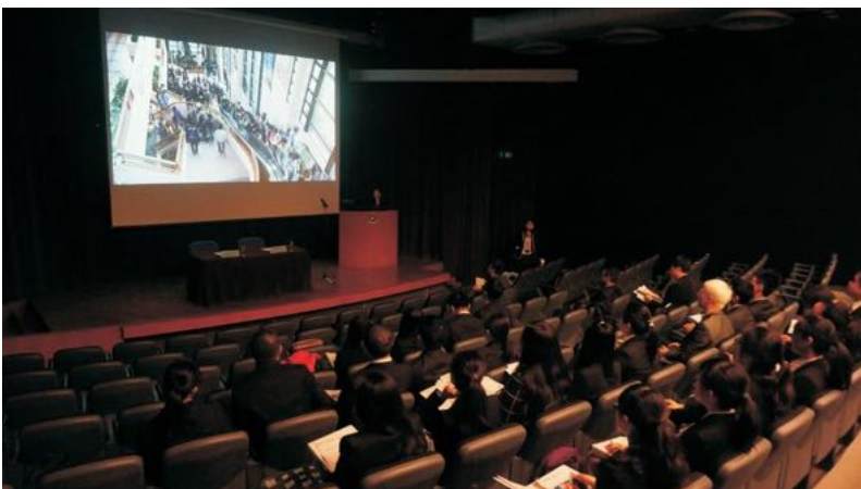
2015年暑期香港医疗 进修项目(1)香港 大学开学典礼留影