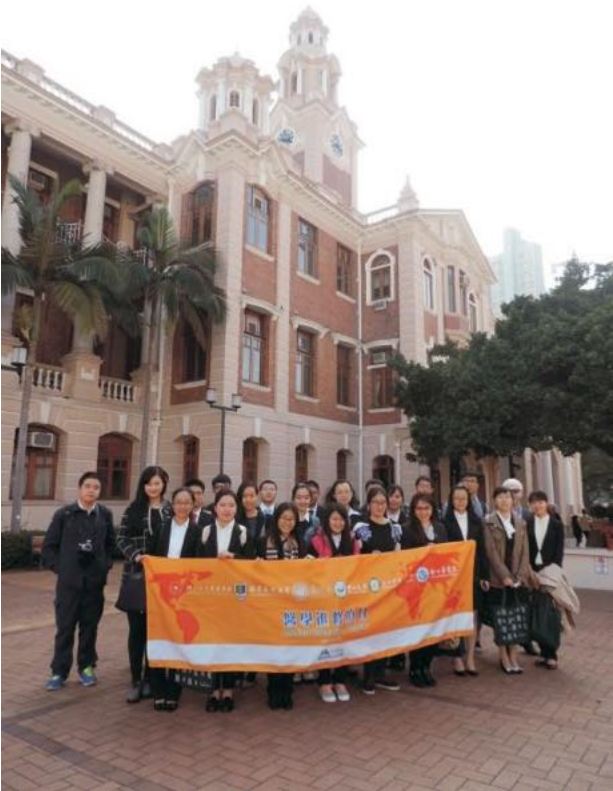
2015年暑期香港医疗进修项目(2) 香港大学余振强医学图书馆留影