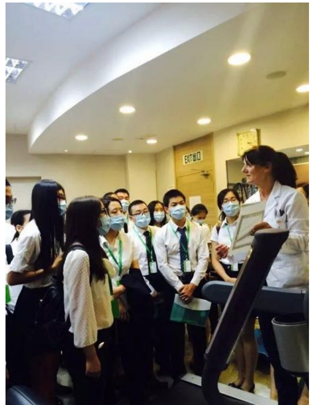
2015年暑期香港医疗进修项目(1) 香港港安医院前留影