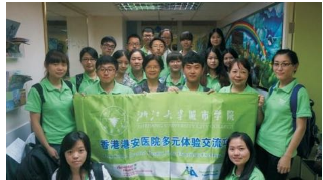
2015年寒假香港醫療交流 團香港醫學博物館前留影