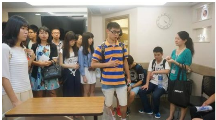
2015年暑期香港医疗进修 项目(2)参观荃湾港安医 院留影