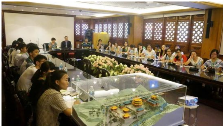
2015年暑期香港医疗进修项目(1) 荃湾港安医院前留影